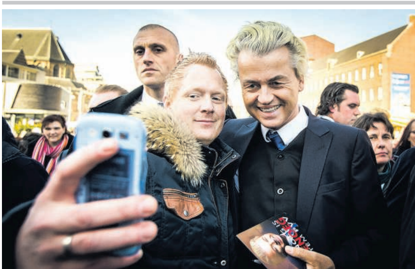
Geert Wilders op de foto met fan bij de aftrap van de PVV-campagne in Rotterdam.